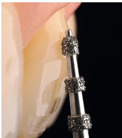
Abb. 1: Der konische Tiefenmarkierer mit Führungsstift (868BP) begrenzt die Eindringtiefe selbst bei zu steiler Positionierung.

EDELHOFF: Auf den ersten Blick könnte man meinen, die Präparation für adhäsiv befestigte Veneers sei einfach. Tatsächlich ist die Präparation für keramische Veneers sehr anspruchsvoll. Sie folgt zwar klaren Prinzipien, kann jedoch patientenspezifisch sehr flexibel sein. Der Zahnarzt darf einerseits nicht zu viel von der verbliebenen Zahnhartsubstanz entfernen, andererseits muss er die Anforderung einer gleichmäßigen Keramikschichtstärke erfüllen. Es soll also innerhalb der engen Grenzen der Präparation im Schmelz zugleich eine werkstoffgerechte Präparationsform erreicht werden. Der Zahnarzt ist sozusagen der Innenarchitekt der späteren Restauration, während der Zahntechniker die Außenform festlegt. Sofern die Präparation nach approximal extendiert wird, muss der Zahnarzt die gleichen Bedingungen auch im Approximalraum sicherstellen. Und dies, ohne den Nachbarzahn zu verletzen. Diese zahlrei-