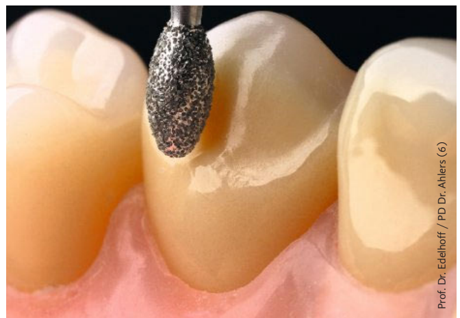
Abb. 6: Die palatoinzisale Präparation für Funktionsveneers an Frontzähnen wird mit einer Eiform (379) durchgeführt.