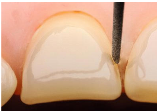
Abb. 5: Mit formgleichen, aber längsseitig halbierten Schallspitzen können die Approximalflächen perfekt ausgearbeitet werden. Die einseitige Beleuchtung schützt den Nachbarzahn.