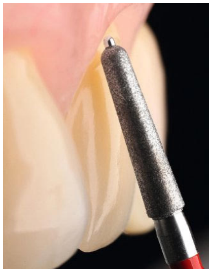
Abb. 4: Bei klassischen Veneers (0,4mm Stärke) eignen sich bei der Präparation der Labialflächen Instrumente mit einem Führungsstift. Sie unterstützen das kontrollierte Arbeiten.