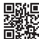
Infos zum Unternehmen

Komet Dental Gebr. Brasseler GmbH & Co. KG Trophagener Weg 25 32657 Lemgo Tel.: 05261 701700 info@kometdental.de www.kometdental.de