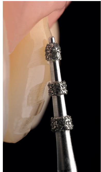
Der konische Tiefenmarkierer mit Führungsstift (868BP) begrenzt die Eindringtiefe selbst bei zu steiler Positionierung.

Wir spüren, dass Zahnärzte verstärkt nach Anwendungslösungen suchen. Nicht das Produkt, sondern die Anwendung steht bei unseren digitalen Themenwelten im Fokus. In der Themenwelt „Vollkeramik & CAD/CAM“ bündeln wir alle Informationen und Services rund um diesen Anwendungsbereich. Wir haben das komplexe Thema keramikgerechte Präparation so heruntergebrochen, dass es nun autodidaktisch für den Zahnarzt viel leichter zu erlernen und umzusetzen ist. Er wird sich im konkreten Fall ja immer eingangs fragen: Wie gehe ich bei dieser Indikation keramikkonform vor und – erst im nächsten Schritt – welche Instrumente helfen mir dabei? Deshalb holen wir ihn bei der jeweiligen Indikation ab (zum Beispiel Veneers, Okklusiononlays, Inlays/Teilkronen oder klassische Kronen). Unter der Rubrik „Veneers“ sind zum Beispiel der Veneer-Kompass und die PVP-Broschüre Dreh- und Angelpunkt für das korrekte Instrumentieren . Aber auch das Thema der Abrechnung wird aufgegriffen. Die Fragen zur korrekten Präparationstechnik sind mit Videos, vielfältigen Fachinformationen und Literaturhinweisen hinterlegt. Er muss nicht mehr suchen. Anstelle „reiner Bohrerabbildungen“ stehen klinische und in-